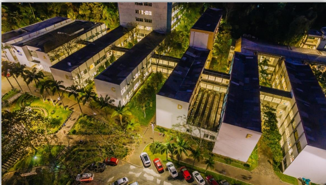
i Campus 1 - FURB

E não para por aí, para que o desenvolvimento seja global, a FURB coopera com mais de 60 Instituições de Ensino de 20 países para realização de intercâmbio, pesquisa e extensão. Mais de 1.200 pessoas foram recebidas na FURB ou saíram para realizar atividades no âmbito internacional.