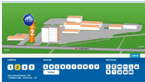
v - Mapa do Campus 2