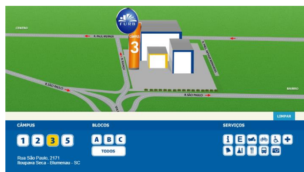
iv - Mapa do Campus 3