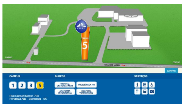
vi - Mapa do Campus 5